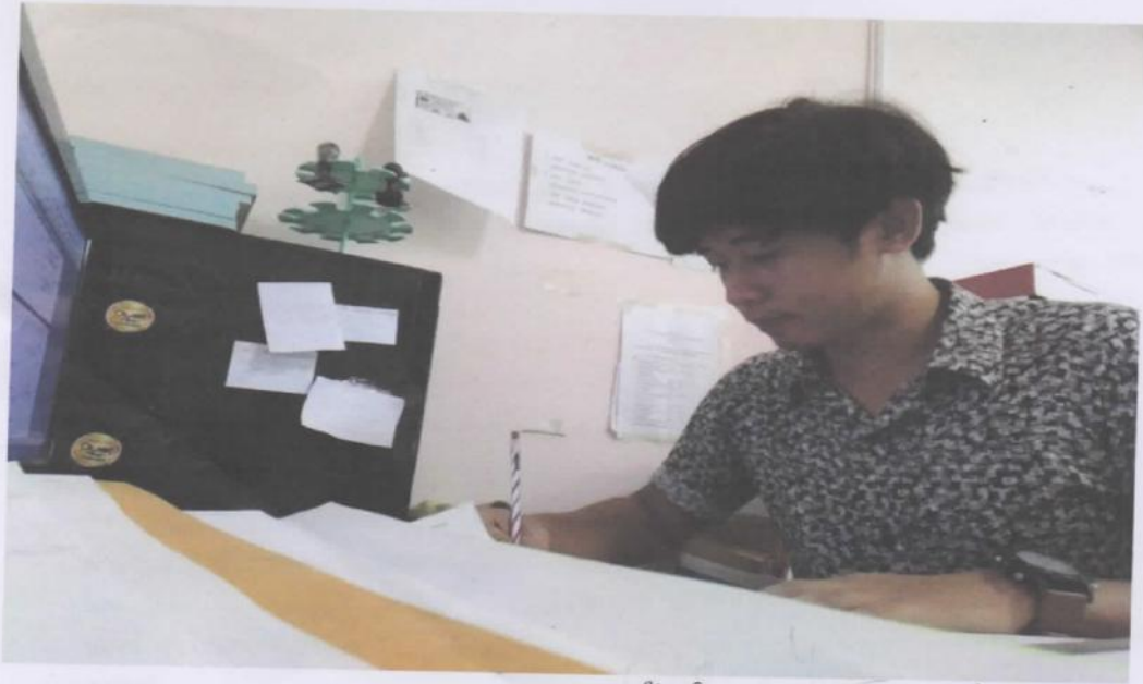
จัดทำแผนปฏิบัติงานตามอำเภอป่าชุมสาย ที่สืบ ผศ. ๕๐๒

☎ 0-3451-2926, 0-3451-3916 🖨 0-3452-1027 ✉ pvlo_knr@dld.go.th