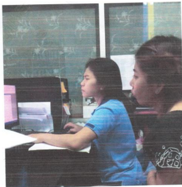
จัดทำระบบฟอร์มเพื่อรวบรวมข้อมูล คชของอำเภอป่าโมกษณ์.