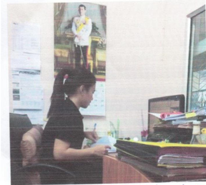
จัดทำแผนปฏิบัติงานอำเภอป่าโมกษณ์ที่รับผิดชอบ.