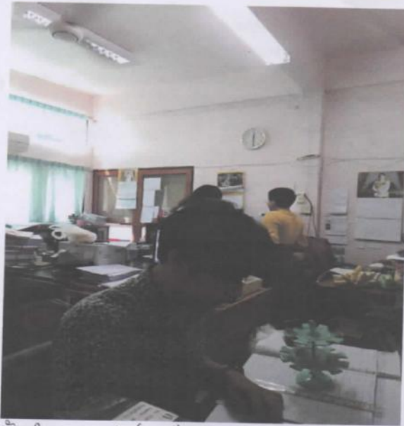
จัดทำแบบฟอร์มเพื่อรวบรวมข้อมูลของอำเภอป่าชุมสาย