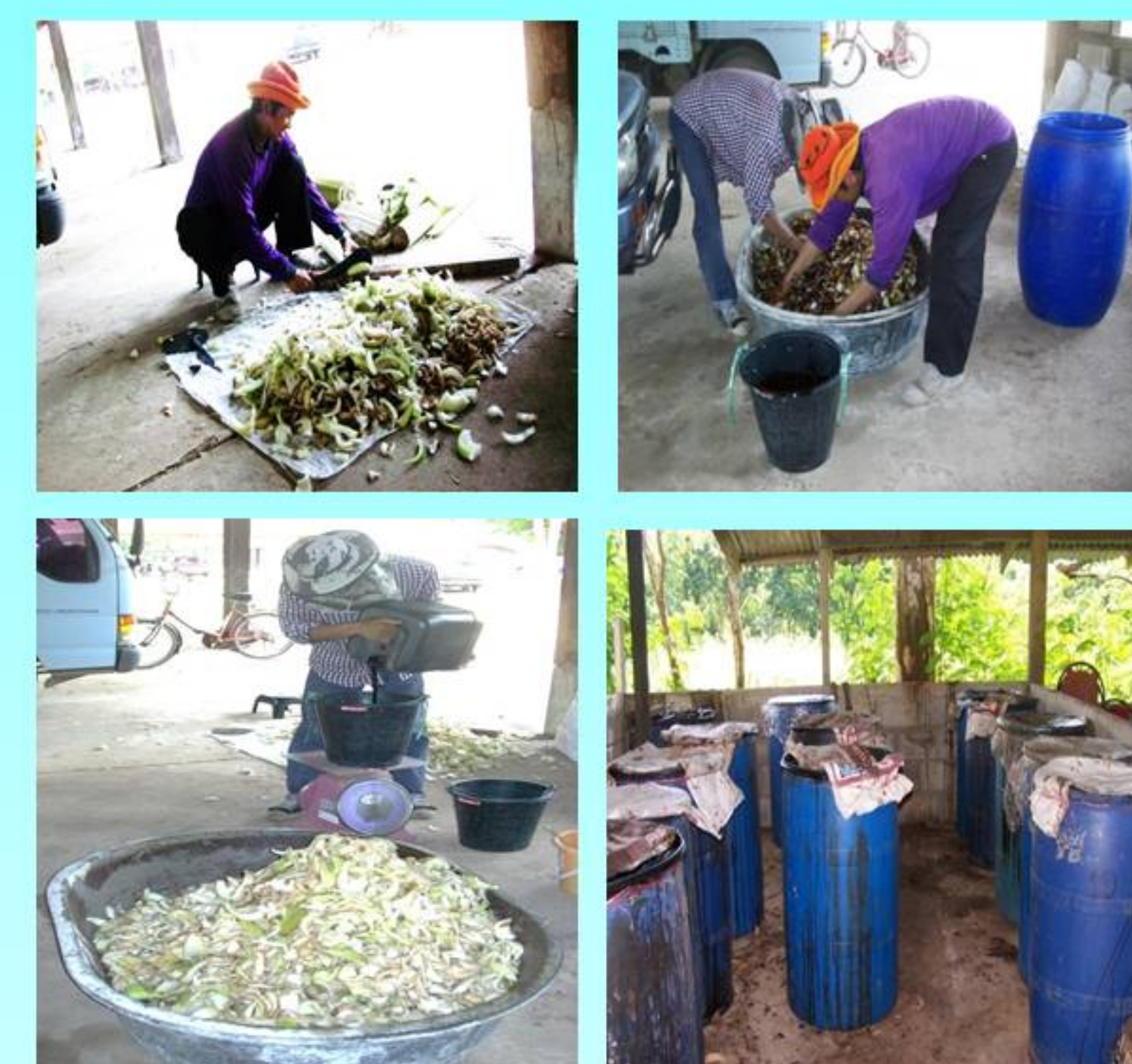
หมายเหตุ อาหารหมักสูตรนี้ใช้เวลาหมักเพียง 5 วัน ก็สามารถนำไปใช้เลี้ยงไก่ได้