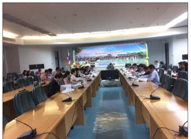
ข่าว : กลุ่มยุทธศาสตร์และสารสนเทศการพัฒนาปศุสัตว์

จัดทำโดย: ว่าที่ร.ต.วุฒิชัย ดาวเจริญพร ลงวันที่: ๒๑ มีนาคม ๒๕๕๙