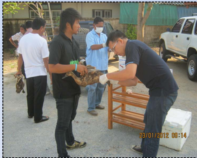
จัดทำโดย กลุ่มพัฒนาสุขภาพสัตว์